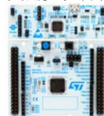
NUCLEO-G070RB / NUCLEO-G071RB (64ピンNucleo)