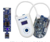
STM32G0316-DISCO / STM32G071B-DISCO (USB Type-C™) ディスカバリーキット